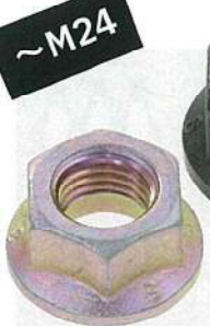
スカートナット 【N0-08-0750】 (焼き無)【N0-08-0760】