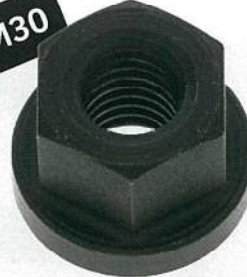
フランジナット (セレート無し) ホルダー 【HA-00-N008】