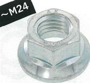
フランジナット (セレート無し) 杉本製 【N0-08-S360】