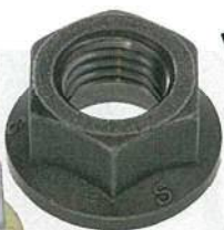
アクティブクロスナット 【N0-08-0Y00】